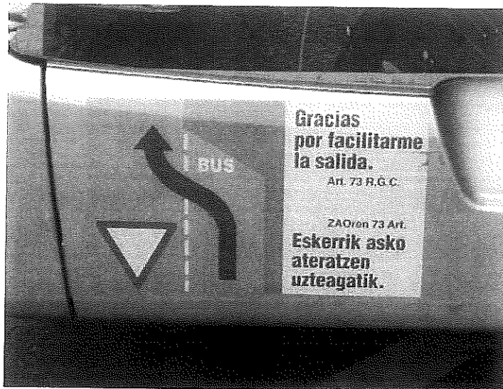
Modelo de cartel nun autobús municipal en Euskadi