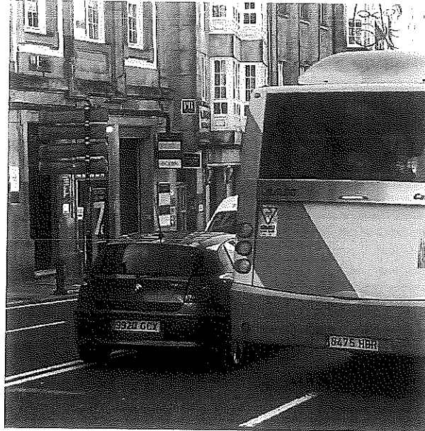
Bus urbano de Santiago con pequeno cartel de ceda ao paso na traseira