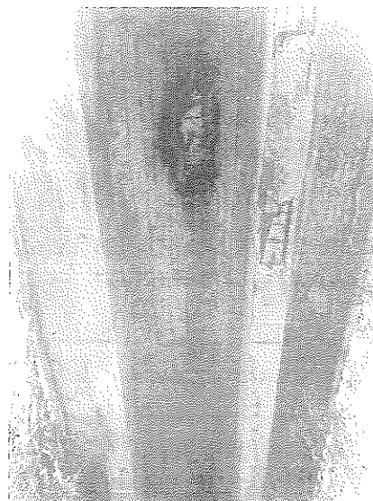
Ponte Igreja-Ramelle (Busto)