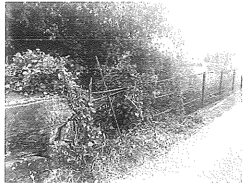
Ponte do Castro (Busto)