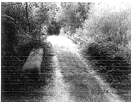
Ponte da Casanova (Busto)