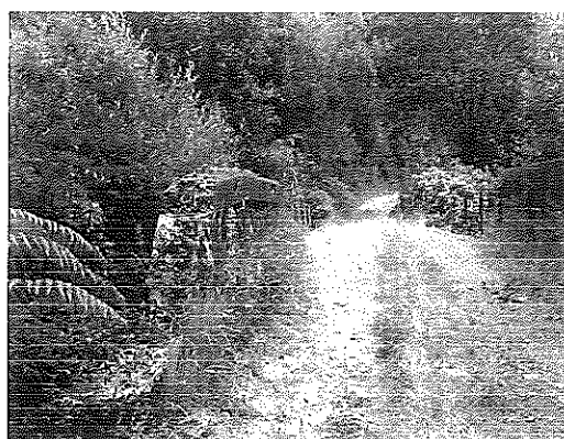
Ponte Chorente (Nemanzo)