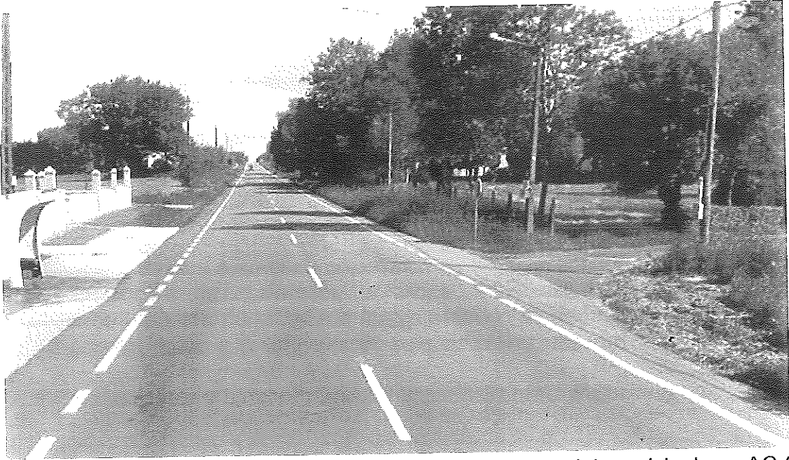
Entronque do vial municipal coa AC-250