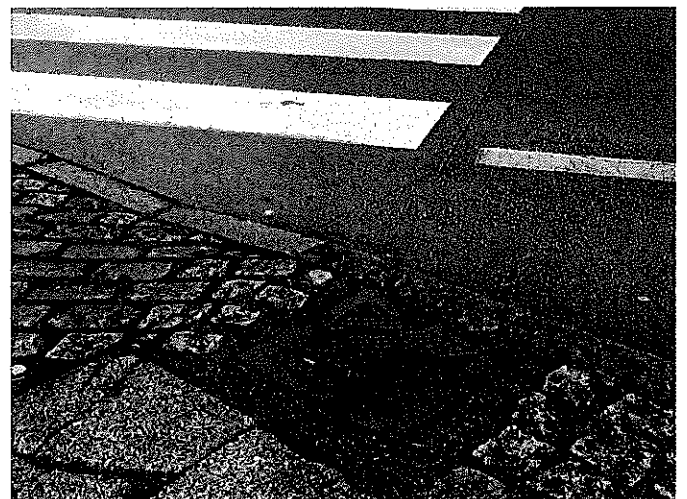
Tapa rompida á beira da entrada do colexio 2/2