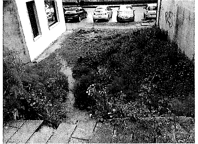
Tramo pendente de urbanizar, desde a rúa Valiño e desde a praza que conecta coa rúa Belgrado