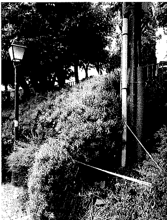
Acometida eléctrica sen rematar na rúa Valiño