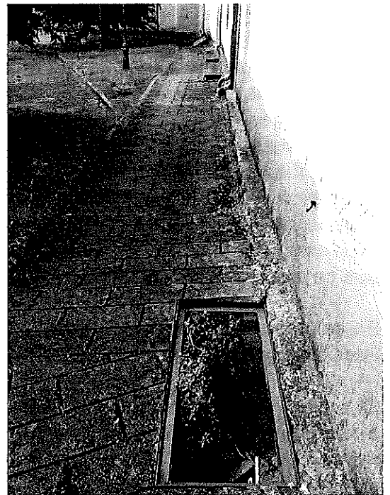
Detalle dun dos ocos carente de protección